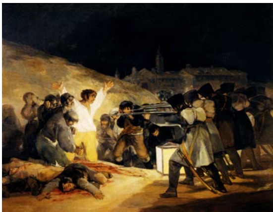
2A. Francisco de Goya: Fusilamientos del 3 de mayo (1814).