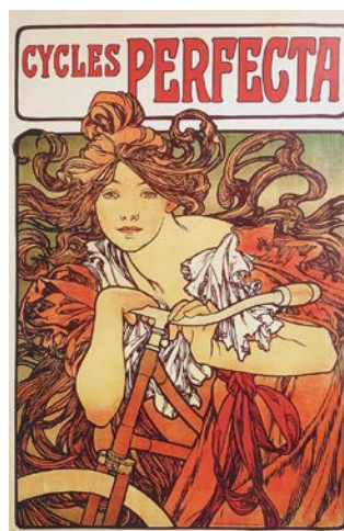
2B. Alfons Mucha: Cycles Perfecta (1902).